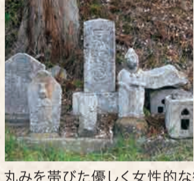
8 貴船神社の北三叉路の観音菩薩

尼僧の姿をした優しい姿の延命地藏菩薩が安置されている。瑠璃殿の裏には土や草に埋もれた状態で石仏が多数ある。