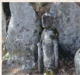
2 指月庵(護摩堂)の地藏菩薩

三匹の猿と見られる顔が、それぞれの文字の中に描かれた遊び心に溢れる道祖神。隣にある青面金剛が刻まれた庚申塔も見事。