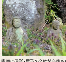
7 法華堂跡の夫婦像

延命地藏菩薩が数体あり、石灯籠にも地藏菩薩が彫刻されている。園内には庚申塔、甲子塔なども多数安置。