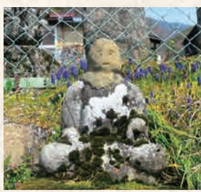
11 庚申訪神社の庚申塔群

数多くの馬頭観音が安置されているが、その中に1つだけ馬の姿が彫られたものがある。他ではあまり見られない珍しい石造物。