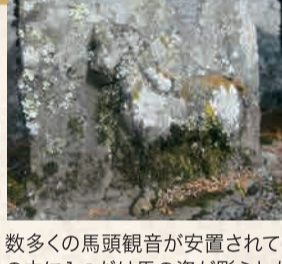
5 八幡神社の馬頭観音

廃庵に僧形・尼形の2体が台座もない状態で土の上に座している。野ざらして、分かりにくい場所に安置されているが心惹かれる石仏。