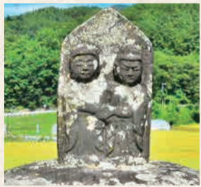
1 板山の道祖神と馬頭観音

ユニークな表情をした十王仏、奪衣婆、人頭杖が寺の露天に並び、地藏菩薩と観音菩薩も優しい表情で安置。