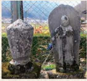
9 水遊園の地藏菩薩

板碑に日月、上半身裸の青面金剛と二鶏三猿を刻むのは延宝8年(1680)に作られた古い様式の庚申塔。境内にも多くの石仏が野ざらして安置。