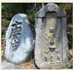
11 庚申訪神社の庚申塔群

板碑に日月、上半身裸の青面金剛と二鶏三猿を刻むのは延宝8年(1680)に作られた古い様式の庚申塔。境内にも多くの石仏が野ざらして安置。