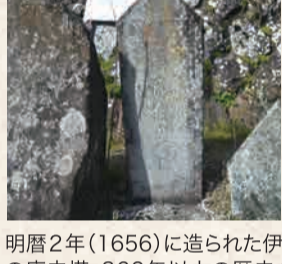
6 伊那谷最古の庚申塔

丸みを帯びた優しく女性的な観音菩薩が安置されている。三叉路の向かいには「江戸」への道しるべもある。