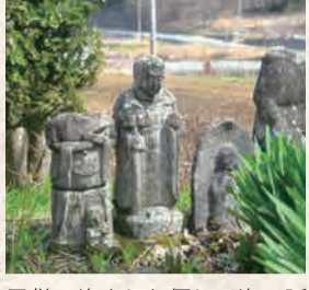
10 瑠璃命殿の延命地藏菩薩

首の取れた石仏に、地元の方が顔を作りました。藤沢の「み」から名前がはじまる集落のどこかに安置されている。