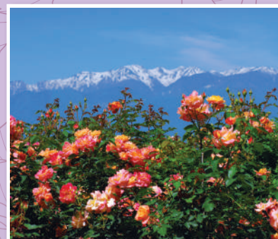
アルプスとアンネのバラ