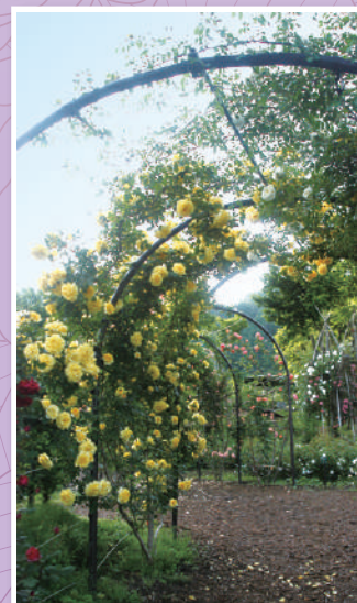
ツルゴールドバニーのアーチ