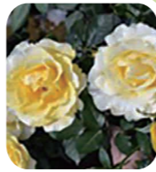
レモンドゥソレイユ