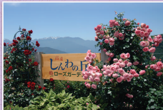
アルプスを望むエントランス