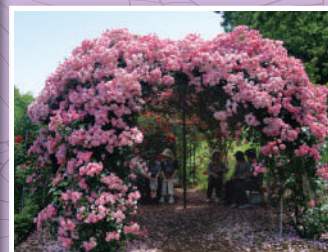
アンジェラのドーム