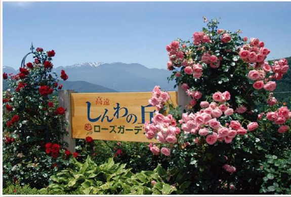
アルプスを望むエントランス