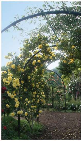
ツルゴールドパニーのアーチ