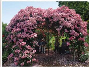
アンジェラのドーム