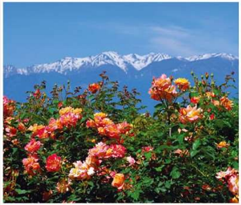
アルプスとアンネのバラ