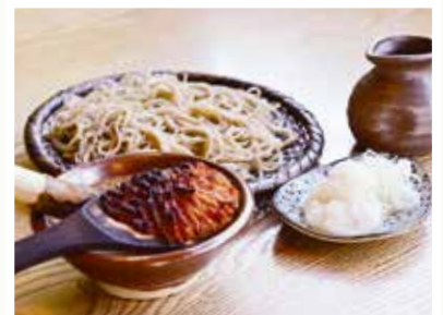
信州そば発祥の地 伊那 高遠そば