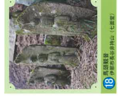
18 馬頭観音 伊那市長谷非持山(七面堂)