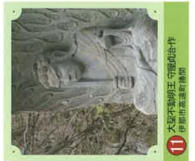
11 大聖不動明王 守屋貞治・作 伊那市高遠町掛鐘