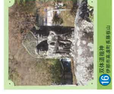
16 双体道祖神 伊那市高遠町長壽原山