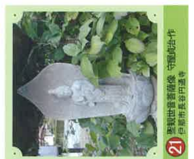
21 聖観世音菩薩像 守屋貞治・作 伊那市長谷門邊寺