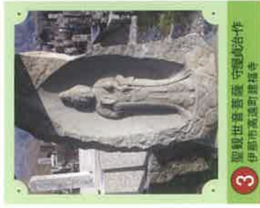
3 聖観世音菩薩 守屋貞治・作 伊那市高遠町建福寺