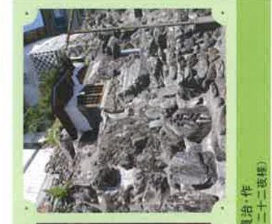
7 延命地藏尊 守屋貞治・作 伊那市高遠町西高遠(二十二夜様)