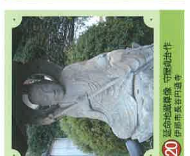
20 延命地藏菩薩 守屋貞治・作 伊那市長谷門邊寺