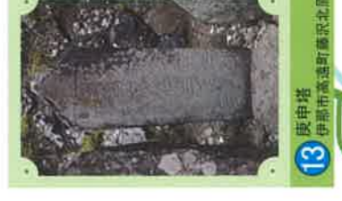
13 庚申塔 伊那市高遠町藤沢北原