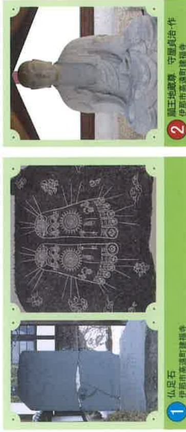
1 仏足石 伊那市高遠町建福寺