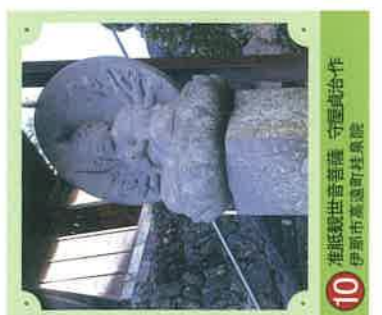
10 准后観世音菩薩 守屋貞治・作 伊那市高遠町桂泉院