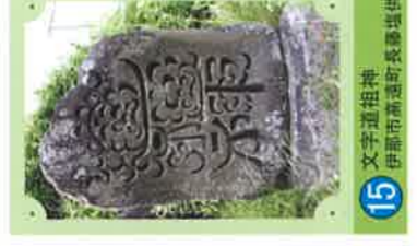
15 文字道祖神 伊那市高遠町長壽原