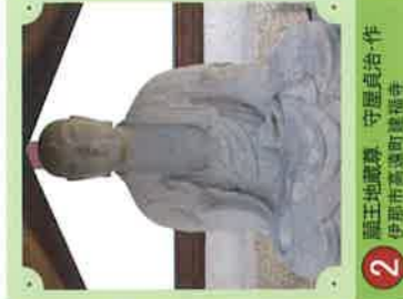
2 鳳王地藏尊 守屋貞治・作 伊那市高遠町建福寺