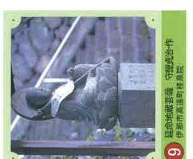
9 延命地藏菩薩 守屋貞治・作 伊那市高遠町桂泉院