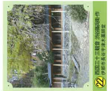
22 西国三十三観音 浜給藤兵衛・作 伊那市長谷宇津木薬師堂