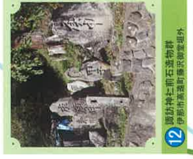
12 諏訪神七前石造物群 伊那市高遠町諏訪御堂塚外