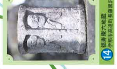
14 福清庵六地藏 伊那市高遠町長壽原