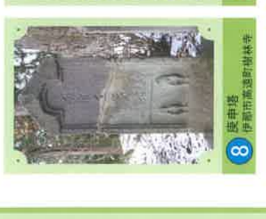
8 庚申塔 伊那市高遠町樹林寺