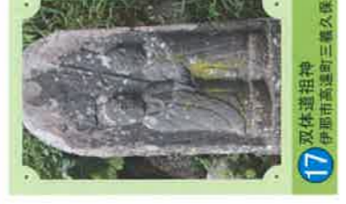
17 双体道祖神 伊那市高遠町三龍久保