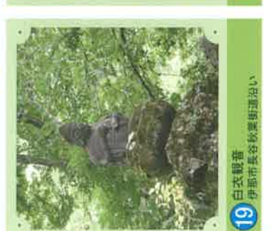
19 白衣観音 伊那市長谷秋葉町通出い