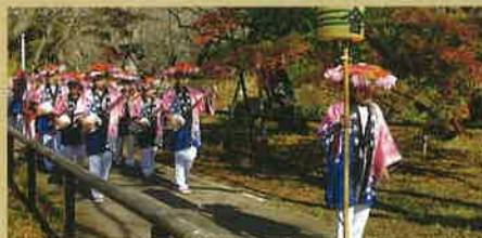
郷土芸能(高遠囃子・高遠太鼓)