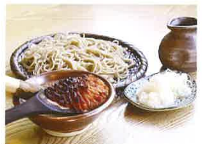
信州そば発祥の地 伊那 高遠そば