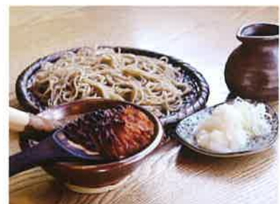
信州そば発祥の地 伊那 高遠そば