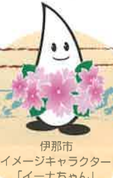
伊那市イメージキャラクター「いなちゃん」