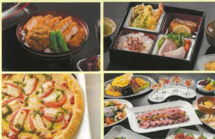
写真はイメージです。実際のメニューと異なる場合がございます。