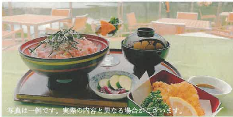
写真は一例です。実際の内容と異なる場合がございます。