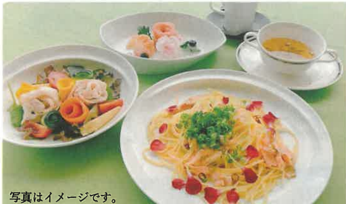
写真はイメージです。