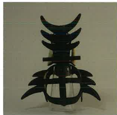
2018年 NODA・MAP公演「贗作 桜の森の満開の下」