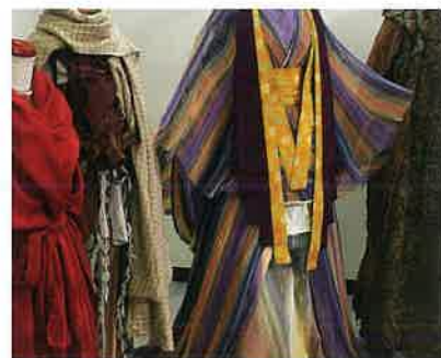
2016-18年 NHK大河ファンタジー「精霊の守り人」 ※写真と展示作品は異なる可能性があります。