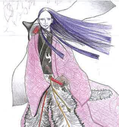
2012年 大河ドラマ「平清盛」