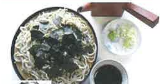
昭和10年創業の昭和浪漫派うどめ屋気の中で味わうそばは別格。ざる(460円)、もり(430円)

伊那市荒井通り町 3391-1 ☎ 0265-72-2324 🕒 11:30~18:30 🍷 水曜 🍻 店近くの市営P利用