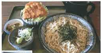
伊那産そば粉を細打ちに仕上げた蕎麦は香り高い風味が楽しめる。ミニソースかつ井とのセットが人気。(1,450円)

伊那市西箕輪 6866-16 ☎ 0265-73-2253 🕒 11:30~20:30(20:00 L.O.) 🍷 火曜(翌日の曜日は営業) 🍻 25台