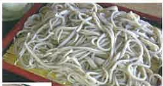
二八名人そば、十割そばなどのほか、季節メニュー・ソースかつ井セット等も有。そば打ち体験あり。(予約制)

伊那市西箕輪 3415 ☎ 0265-74-1831 🕒 11:00~17:30(17:00 L.O.) 🍷 木曜 🍻 周辺P 300台