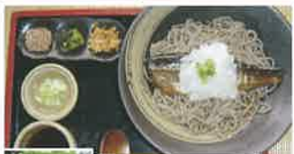
地産の石臼挽き、味が濃くて風味が強い十割そば(1,030円)が味わえる。写真は、ぶっかけおろしにしんそば(1,540円)

伊那市西箕輪と地 6563 ☎ 0265-78-9966 🕒 11:00~14:00(夜は要予約) 🍷 水曜 🍻 20台