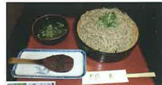
そばつゆ味の起源、焼味噌味からつゆそば(750円)が人気

伊那市坂下区入船 3308 ☎ 0265-72-2130 🕒 17:00~22:30 🍷 日曜 🍻 店近くの市営P利用