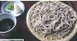
そばつゆに大根のしぼり汁を加えた「辛つゆ」。焼味噌味でいただく「行者そば」(1,000円)が名物。

伊那市内の萱 7088-2 ☎ 0265-76-5534 🕒 11:00~15:00 🍷 水・木曜(1、2月は不定休)HP: 営業で確認ください 🍻 12台