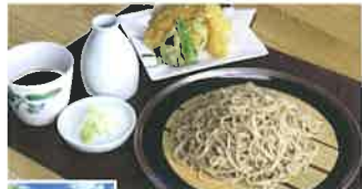
備州産のそば粉のみを使用し、つゆに使用する湯も店内で削ってダシを取っています。十割そば(総量限定)や、塩漬のそばがおすすめです。

伊那市西春近広域農道10 ☎ 0265-78-4630 🕒 11:00~14:30(そば売り切れ次第終了) 🍷 水曜 🍻 50台