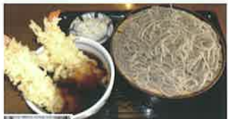
地元産のそば粉を石臼挽き、手打ちで提供。「天せいる」(1,100円)が人気。ご主人の海釣りの刺身も美味しい。

伊那市山寺八幡町 1918-1 ☎ 0265-72-2601 🕒 11:00~14:00、17:00~21:00 🍷 木曜 🍻 店前の市営P利用