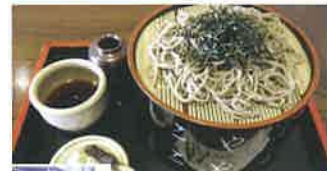
1973年創業の老舗そば専門店。天ざる(1,540円)、ざる(820円)、もり(720円)がおすすです。

伊那市中央 4498-6 ☎ 0265-72-0333 🕒 11:00~17:00 🍷 火・水曜 🍻 7台