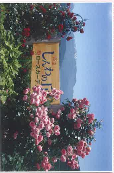
アルプスを望むエントランス