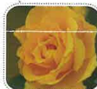
ゴルドルゼ (6月中旬から)