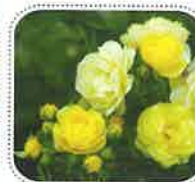
ゴールデンボーダー (6月中旬から)