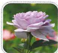
ブルーバニー (6月中旬から)