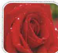
メリナ (6月初旬から)