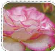
ほのか (6月初旬から)