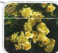
ツル ゴールド パニー (6月初旬から)