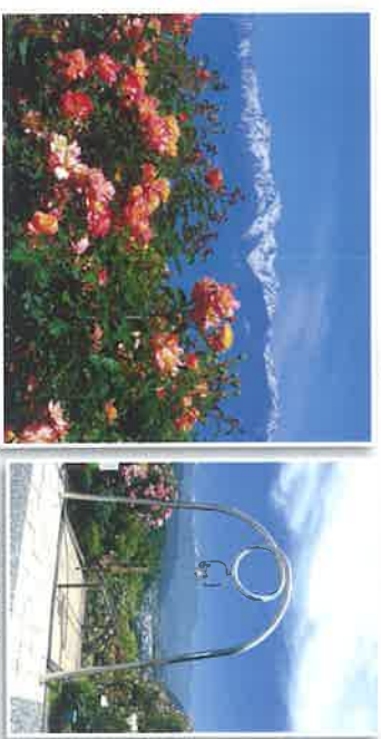
アルプスとアンネのバラ