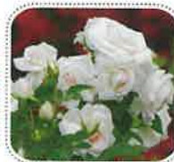
アスピリンローズ (6月中旬から)