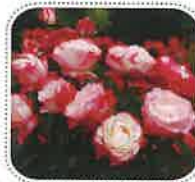
ノスタルジー (6月中旬から)