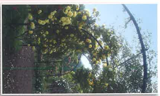
ツルコーラルバニーのアーチ