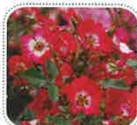
シェリーメイディランド (6月初旬から)