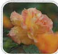
アンネのバラ (6月初旬から)