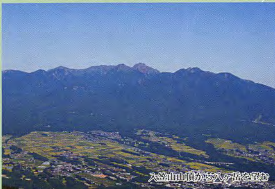
入笠山山頂から入笠谷を望む