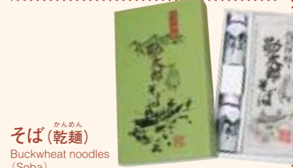
そば(乾麺) Buckwheat noodles (Soba) 信州の本格派そばを思い出とともに持ち帰り。