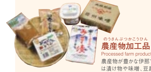
のうさんぶつかこうひん 農産物加工品 Processed farm products 農産物が豊かな伊那では漬物や味噌、豆腐などの加工品も充実。