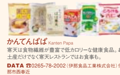
かんてんぱぱ Kanten Papa 寒天は食物繊維が豊富で低カロリーな健康食品。お土産だけでなく寒天レストランではお食事も。 DATA ☎0265-78-2002 (伊那食品工業株式会社) 伊那市西春近