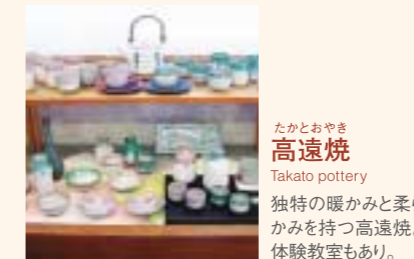
たかとおやき 高遠焼 Takato pottery 独特の暖かみと柔らかみを持つ高遠焼。体験教室もあり。