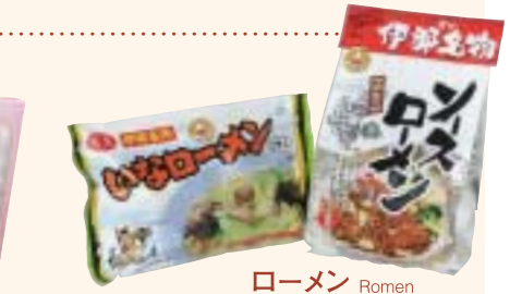
ローメン Romen 伊那名物はお土産としても好評。ぜひご家庭でも。