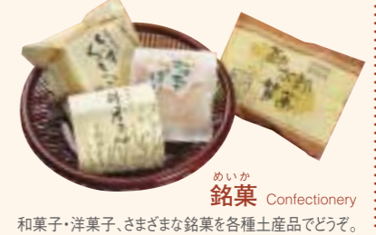
めいが 銘菓 Confectionery 和菓子・洋菓子、さまざまな銘菓を各種土産品でどうぞ。