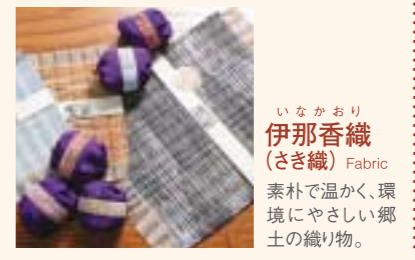
いなかおり 伊那香織 (さき織) Fabric 素朴で温かく、環境にやさしい郷土の織り物。