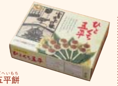
ごへいもち 五平餅 Gohei-mochi rice cake かわいい一口サイズのものから、大判型のものまである。