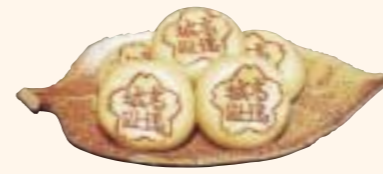
たかとお 高遠まん頭 Takato Manju bun 高遠城主の御用菓子として庶民にも親しまれたまん頭。