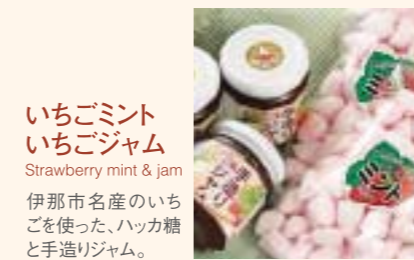
いちごギント いちごジャム Strawberry mint & jam 伊那市名産のいちごを使った、ハッカ糖と手造りジャム。