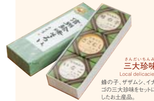
さんだいちんみ 三大珍味 Local delicacies 蜂の子、ザザムシ、イナゴの三大珍味をセットにしたお土産品。

伊那ならではの逸品の数々！ 旅の思い出にぜひどうぞ。 思う存分味わう 伊那の食と名産