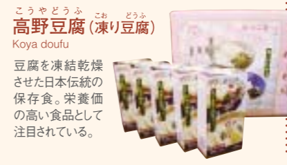
こうやどうふ 高野豆腐(凍り豆腐) Koya doufu 豆腐を凍結乾燥させた日本伝統の保存食。栄養価の高い食品として注目されている。