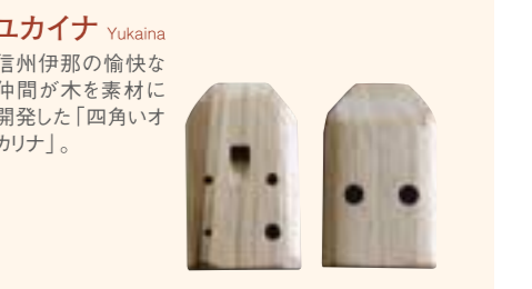
ユカイナ Yukaina 信州伊那の愉快な仲間が木を素材に開発した「四角いオカリナ」。