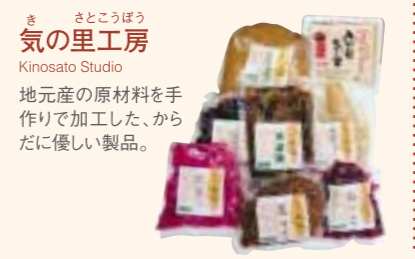
き きの里工房 Kinosato Studio 地元産の原材料を手作りで加工した、からだに優しい製品。