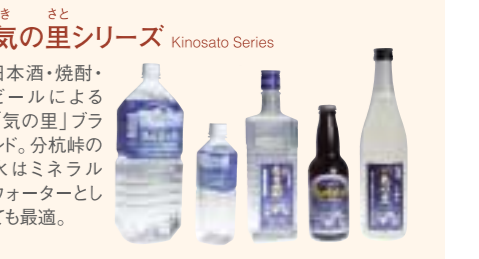
き きの里シリーズ Kinosato Series 日本酒・焼酎・ビールによる「きの里」ブランド。分杭峠の水はミネラルウォーターとしても最適。