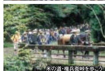
米の道・権兵衛峠を歩こう