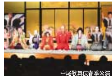
中尾歌舞伎春季公演