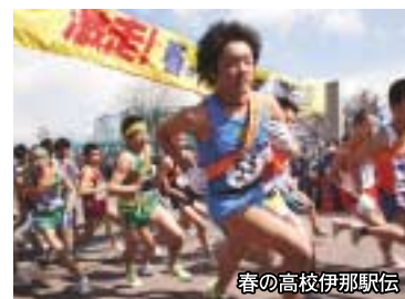
春の高校伊那駅伝