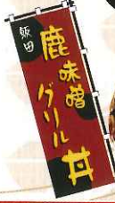
鹿味噌 Grill 丼

地元で獲れた鹿肉をやわらかく調理し、さっぱりと食べられます。ゆずの香りがほんのり漂う絶品どんぶり。現在、飯田市南信濃和田の星野屋のみで味わえる貴重な逸品。