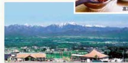
みはらしファーム