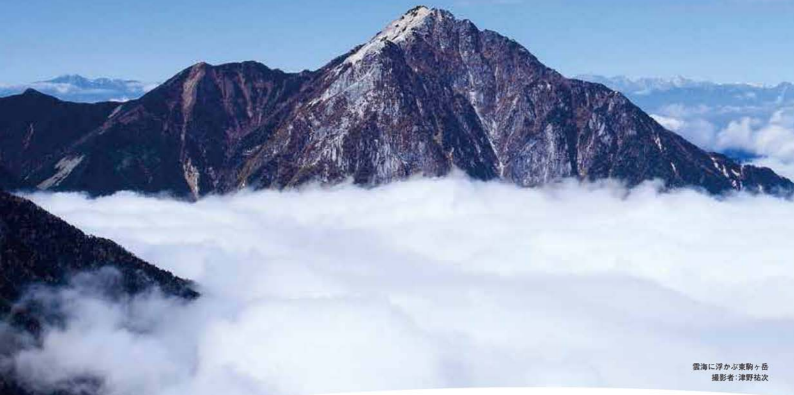
雲海に浮かぶ東駒ヶ岳

その先にある景色が見たい。 そこにしか吹かない風を感じたい。 忙しい日常を手放して、 もう一人の自分に会おう旅をしてみませんか。